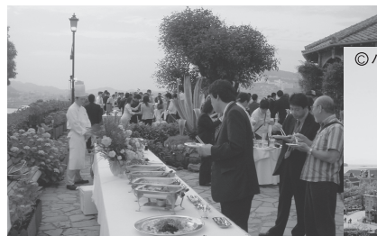
長崎市：グラバー園の 野外懇親会