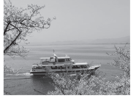
滋賀県：琵琶湖 海津大崎