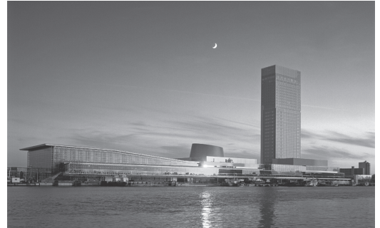
新潟市：朱鷺メッセ