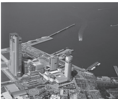
高松市：サンポート高松