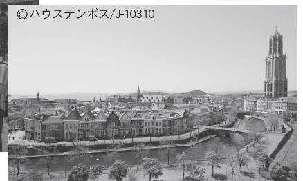
佐世保市：ハウステンボス