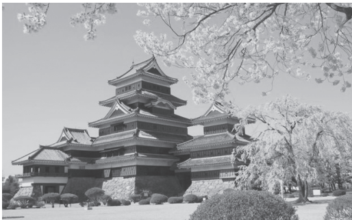
松本市：国宝松本城