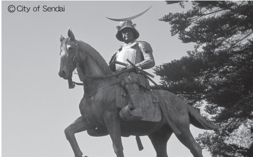
仙台市：伊達政宗騎馬像